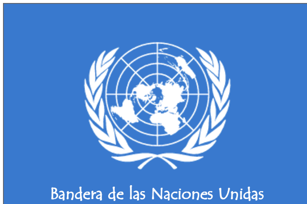
Bandera de las Naciones Unidas

Por tanto, nuestros respectivos gobiernos, por medio de representantes reunidos en la ciudad de San Francisco, que han exhibido sus plenos poderes, encontrados en buena y debida forma, han convenido en la presente Carta de las Naciones Unidas, y por este acto establecen una organización internacional que se denominara las Naciones Unidas.